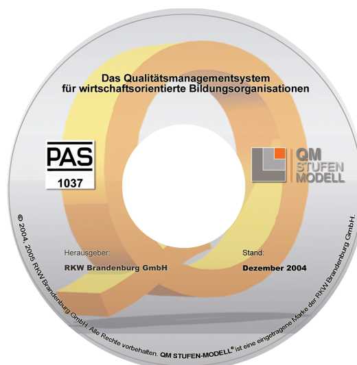
Abb. 2: Flash-Animations-CD

Dieses Kompendium wird allen Nutzern als Print und für angemeldete Nutzer des virtuellen competence centers online zur Verfügung stehen. Für die übersichtliche Darstellung des Modells und seiner Anforderungen empfehlen wir unsere interaktive Flash-Animations-CD.